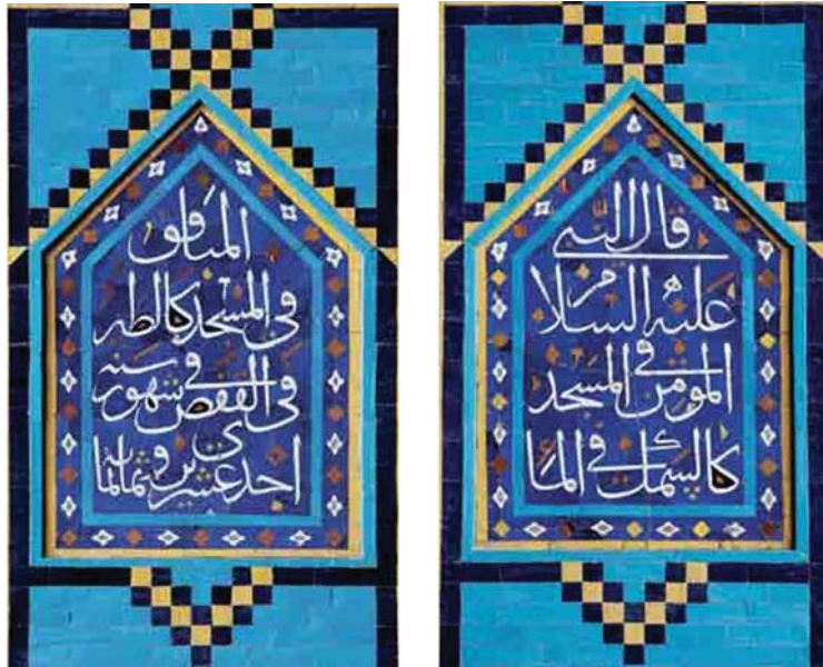
تصویر ۳. کتیبه‌های داخل ایوان مقصوره با مضمون حدیث از پیامبر اکرم صلی الله علیه.

و همواره می‌کوشیدند از این موضع در جهت تشویق و ترغیب اعتقادات مذهبی مردم استفاده کنند. انجام این مهم در شهر مشهد و حرم مطهر امام رضا (ع) که در آن دوره از رونق بالا و زائران پرشماری برخوردار بود می‌توانست آنها را به اهداف مورد نظر برساند.