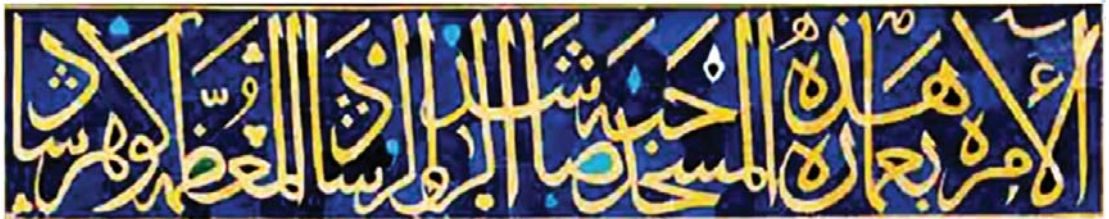
تصویر ۱. رقم بانی مسجد گوهرشاد، مأخذ: صحراگرد، ۱۳۹۲.

۱. در انتهای کتیبه دور ایوان مقصوره در پایه چپ ایوان نام معمار این بنای عظیم به یادگار مانده است: «عمل العبد الضعیف الفقیر المحتاج بعنایت الملک الرحمن قوام الدین بن زین الدین شیرازی الطیان» این کتیبه تنها رقم موجود از استاد قوام الدین شیرازی است که نام او در آن بدون لقب «استاد» آمده است (کلچین عارفی، ۱۳۸۸: ۸۵). همچنین بنا بر نظر برخی از محققان استفاده از کلمه طیان حاکی از اظهار فروتنی قوام الدین در کار ساخت این مسجد است چرا که اصطلاح طیان را برای بنایی به کار می‌بردند که با خشت و گل کار می‌کرد در حالی که در مسجد گوهرشاد هیچ نوع خشتی به کار نرفته است (ویلبر و گلمبک، ۱۳۷۴: ۶۱). این بیان متواضعانه یادآور این عبارت از قرآن است که خداوند انسان را از تکه‌ای خاک یا گل (طین) آفریده است و گویی تأکیدی است بر اینکه کار معمار در خلق کردن و کار با گل صنعتی است خدایی. شاید به همین دلیل باشد که حافظ‌ابرو مورخ هم عصر استاد نیز او را با چنین صفتی معرفی می‌کند: «استاد قوام الدین که در صنعت طیانی واحد ما له الثانی است» (حافظ‌ابرو، ۱۳۴۹: ۱۰). استفاده از صفات عبد، ضعیف، فقیر و محتاج نیز مؤید این تواضع و آداب مرسوم در معماری سنتی است. اساساً هنرمند سنتی در فرایند آفرینش هنری خویش به دنبال تزکیه است و سعی دارد تا از طریق مکاشفه و شهود، رها از متن واقعیت، به حقیقت و باطن امور دست یابد و در این مسیر نیازی نمی‌بیند تا نام خود را آشکار نماید اگر هم نامی به میان می‌آورد آن را با القابی از سر خشوع و بندگی مزین می‌سازد تا باور خود را که همانا رسیدن به حقایق امور و بندگی در برابر ذات اعظم و هنرمند مطلق عالم است به سرانجام رساند (بلخاری، ۱۳۸۸: ۴۲-۴۱).