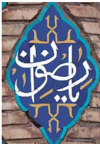
تصویر ۴. کتیبه‌های ترنجی با ذکر اسماء الهی و محراب‌گونه حدیث بر مناره مسجد گوهرشاد. مأخذ: همان.