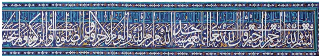
تصویر ۲. بخش آغازین کتیبه دور ایوان مقصوره به خط بایسنغر، مأخذ: همان