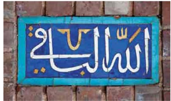
تصویر ۴. عبارت اعظم «الله الباقی» پرتعدادترین کتیبه مسجد گوه‌رشاد.

اسماء الحسنی نگارش یافته بر این کتیبه‌های ترنجی شکل عبارت‌اند از: «یا حیان، یا مقرب، یا عالی، یا جبار، یا مرضی، یا مخفی، یا محی، یا سامع، یا منصور، یا منان، یا رضوان، یا باقی، یا حکیم، یا رحمان، یا قوی، یا علیم، یا رادع، یا رشید، یا ودود، یا دیان، یا رحیم، یا وهاب، یا هادی، یا سبحان، یا جنان، یا برهان، یا مبین، یا علی، یا ماجد، یا نور، یا هو، یا محمد، یا جواد» (همان). مجموع این اسامی الهی در دعایی به نام جوشن کبیر وجود دارد و شیعیان قرائت آن را در شبهای قدر از افضل اعمال می‌دانند. در عقب‌نشینی دهانه ایوان مقصوره، دو قاب کتیبه‌ای در دو طرف ایوان قرار دارند که به لحاظ ترکیب خط و متن احتمالاً از کارهای بایسنغر بن شاهرخ به شمار می‌روند (صحراگرد، ۱۳۹۲: ۱۶۹). بر پایه غربی ایوان به خط ثلث: «سبحان ربی العظیم و بجمده» و به خط کوفی «لا حول و لا قوه الا بالله العلی العظیم» و بر پایه شرقی: «سبحان ربی الاعلی و بجمده» و به خط کوفی: «سبحان الله و الحمد لله و الله اکبر» آمده