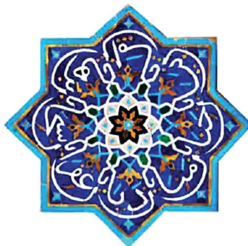
تصویر ۶. تکرار اسماء الهی با ختم به حرف «ن»، مأخذ: همان.

«سبحان الله و الحمد لله» را در لبه دهانه ایوان‌های شرقی و غربی به نمایش گذاشته‌اند (اعتمادالسلطنه، ۱۳۶۲: ج ۲، ۱۴۶). در کتیبه‌های زیر طاق این دو ایوان نیز هشت نام از اسماء الهی با مضمون «یا حنان، یا منان، یا دیان، یا غفران، یا سبحان، یا برهان، یا امان، یا بیان» در شمشه‌های هشت پر به خط ثلث تزئینی نگارش یافته‌اند که براساس اصالت طرح از آثار دوره تیموری به شمار می‌روند و به نظر می‌رسد در دوره‌های بعد مورد بازسازی قرار گرفته‌اند. متن این کتیبه‌ها متشکل از اسمائی است که به حرف «ن» ختم می‌شوند و چرخش دایره‌وار آنها حرکتی از سماع صوفیان را در نزدیکی معنوی با خالق یکتا به نمایش می‌گذارند (تصویر ۶). از سوی دیگر کاربرد ۸ نام از اسماء الهی را می‌توان با تبرک این عدد به نام امام رضا (ع) به‌عنوان هشتمین امام شیعیان در حرم مقدس ایشان در ارتباط دانست.