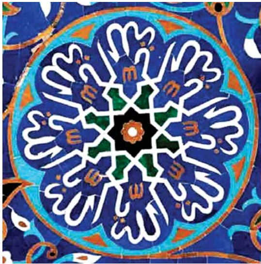
تصویر ۷. تکرار ذکر یالله بر کتیبه‌های طرح شمسه‌ای.